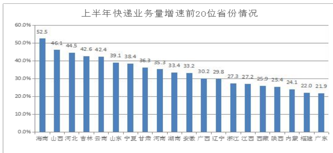
2020年上半年快递业务量排名前20位省份情况（数据来源：国家邮政局）

中西部地区增速加快。 上半年，11省份快递业务量增速超过30%，18省份增速高于全国水平22.1%，主要分布在中西部地区。业务量排名前十位城市依次是金华（义乌）、广州、深圳、上海、杭州、北京、揭阳、苏州、东莞、泉州，业务量增速排名前十位城市依次是潮州、汕头、邢台、石家庄、金华（义乌）、廊坊、临沂、揭阳、昆明、济南、长沙。