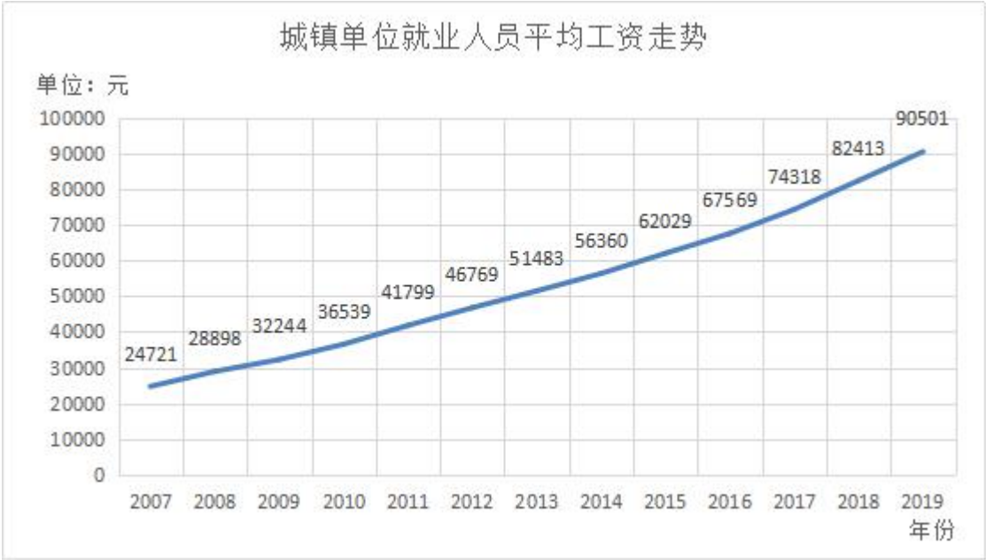
2008 年至 2019 年城镇单位就业人员平均工资走势

工资为 90501 元，较 2008 年的 28898 元增加 2 倍以上。2018 年第一财经研究院《中国与全球制造业竞争力》报告显示，2008 年金融危机后中国的单位劳动力成本增长速度高于全球平均水平。快递业企业用工成本上升，平均单件收入下降，行业利润空间压缩，可能对后续转型升级造成一定影响。