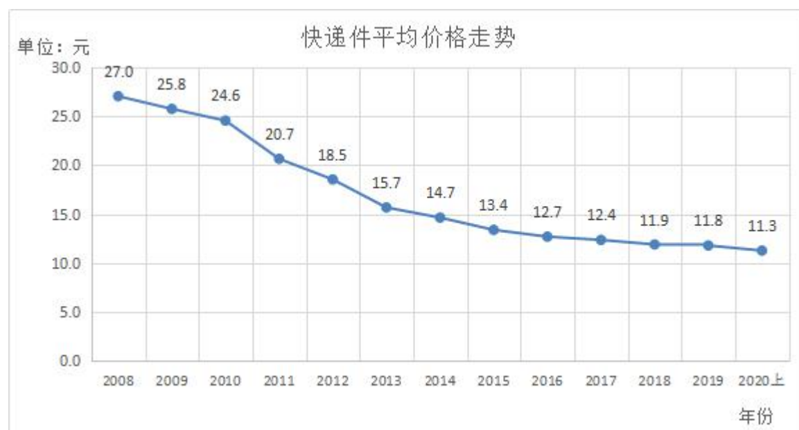
2008 年至 2020 年上半年快递件平均单价走势

快递价格持续下行。 快递件平均单价从 2008 年 27 元持续下降，2019 年降至 11.8 元，降幅达 56%。国内件均价由 2008 年 17.4 元降至 2019 年的 7.4 元，降幅 57%。2020 年上半年，国内件保持下降势头，均价降至 7 元。快递业务平均单价为 11.3 元，同比仍下降 7.8%。