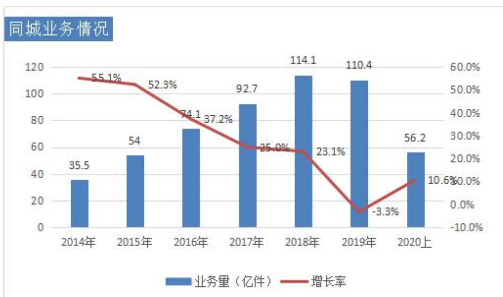
2014年至2020上半年同城快递业务量及增速 （数据来源：根据国家邮政局公开数据整理）

中西部地区增速加快。 上半年，11省份快递业务量增速超过30%，18省份增速高于全国水平22.1%，主要分布在中西部地区。业务量排名前十位城市依次是金华（义乌）、广州、深圳、上海、杭州、北京、揭阳、苏州、东莞、泉州，业务量增速排名前十位城市依次是潮州、汕头、邢台、石家庄、金华（义乌）、廊坊、临沂、揭阳、昆明、济南、长沙。